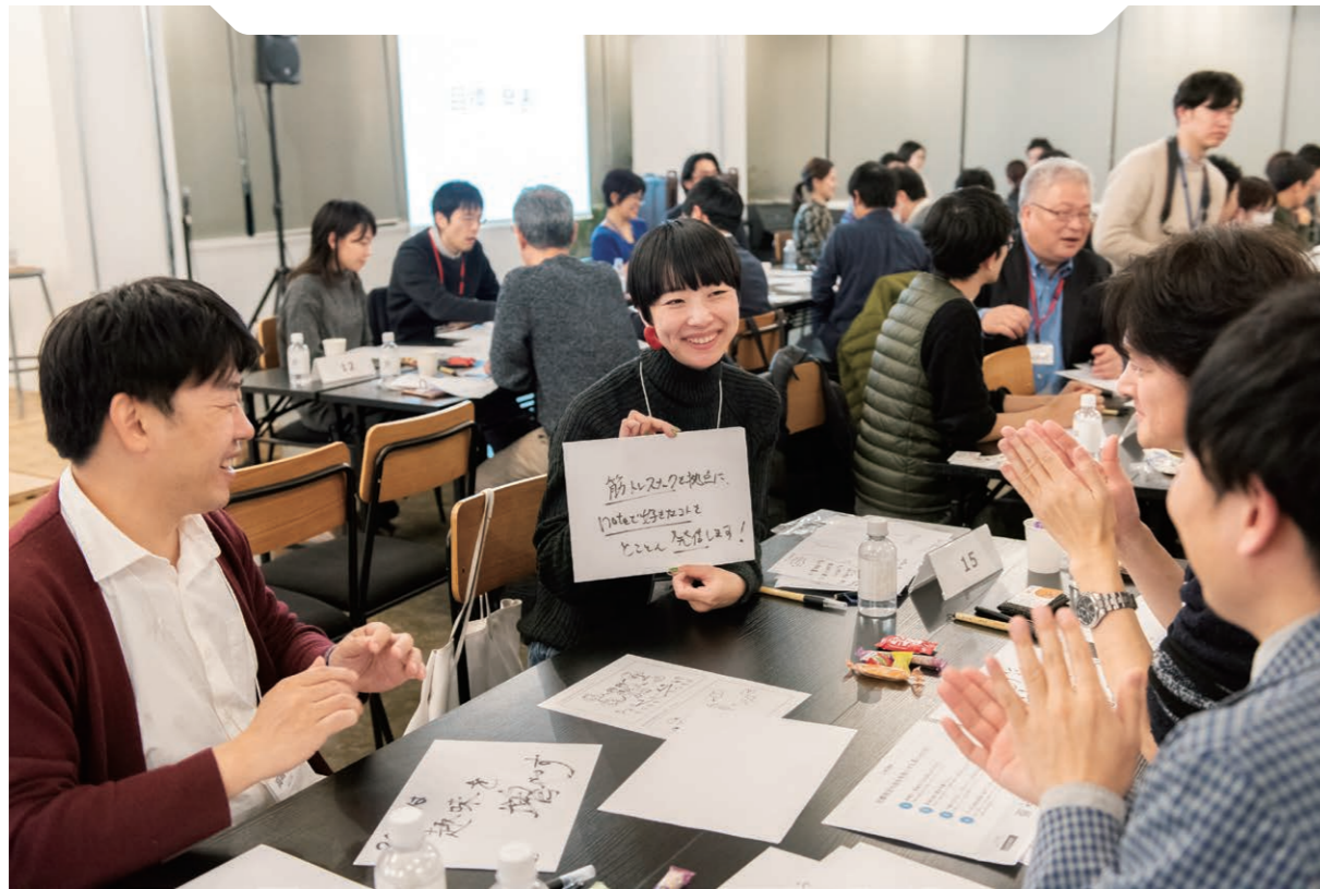
写真はコロナ禍前の「タニモク」イベントの実施風景です。