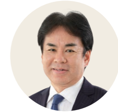
静岡県立大学 経営情報学部 教授 地域経営研究センター長 学長補佐

観光の質を向上させるためには、名所旧跡や著名な観光地は必要ありません。それぞれの地域が独自の個性を発揮してブランド力を高めれば、観光客は自然と引き付けられ、日本全体の観光の魅力度を向上させることができるでしょう。